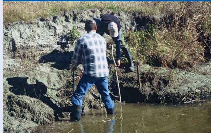
La rangée initiale de perches pour les barrières de fascines est placée à ras l'eau. Ces perches ont généralement un diamètre plus grand que celles placées horizontalement derrière cette rangée. Au moins 80 p. 100 des perches devraient être dans la terre comme cela est montré ici.

La lame en saillie à jet d'eau a été spécialement conçue afin d'utiliser l'eau sous pression élevée en vue de forer à l'aide de l'eau un trou dans la terre pour planter les boutures.