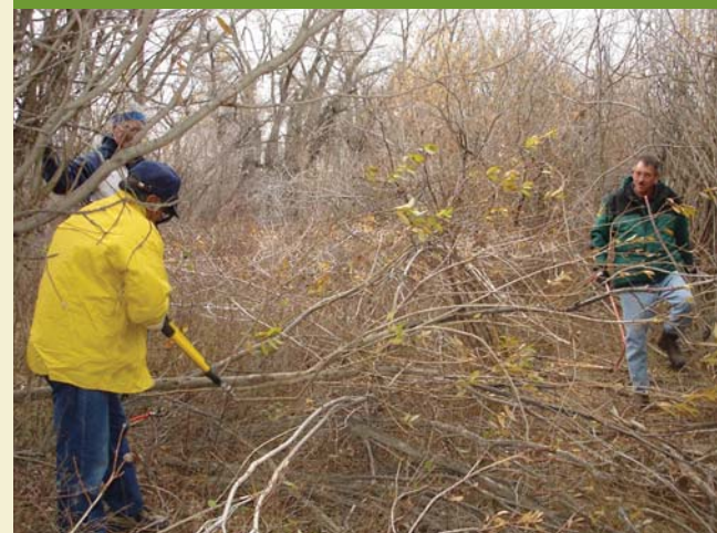
Les ébrancheurs sont utilisés en vue de tailler les branches d'une tige. Tailler toutes les branches qui sont de moins de 2 cm.