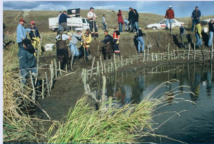
La construction de barrières de fascines dans le ruisseau West Nose. Les outils et les techniques de génie biologique sont assez simples, mais le processus peut demander beaucoup de main d'œuvre.